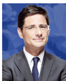
Nicolas Dufourcq DG de Bpifrance