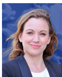
Axelle Lemaire Ex-Secrétaire d'Etat du Numérique et de l'Innovation