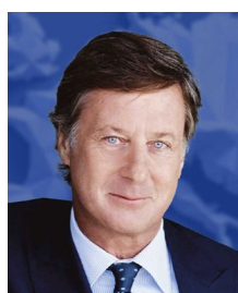
Sébastien Bazin PDG AccorHotels

CONTACT: contact@thedigitalnewdeal.org | WEBSITE: www.thedigitalnewdeal.org